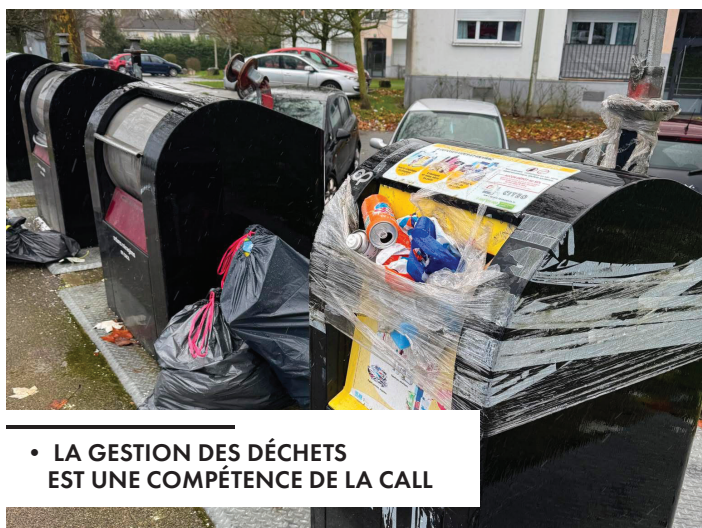
• LA GESTION DES DÉCHETS EST UNE COMPÉTENCE DE LA CALL